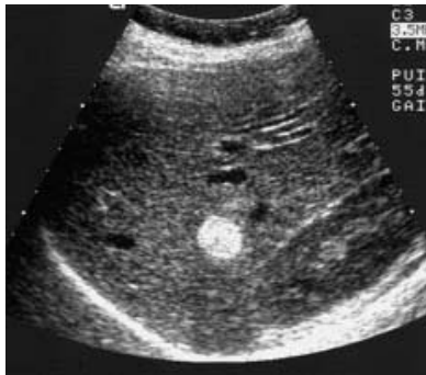
Image échographique du foie au dessus du rein droit

Deux salles du Département sont équipées chacune d'un échographe de dernière génération. Les logiciels embarqués permettent de travailler en différents modes 2D, dont les modes doppler pulsé, doppler couleur et doppler énergie, ainsi qu'en mode 3D pour les reconstructions d'images.